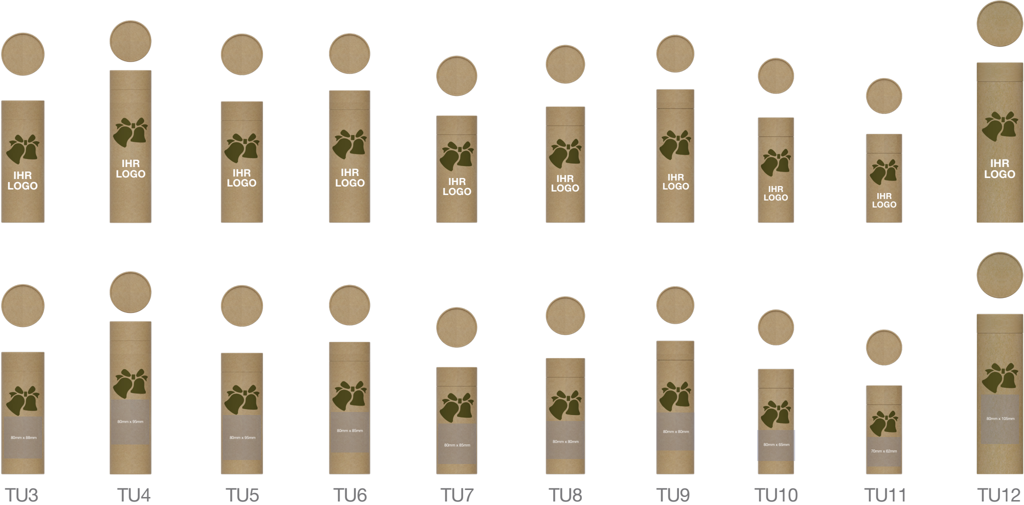
TU3 TU4 TU5 TU6 TU7 TU8 TU9 TU10 TU11 TU12